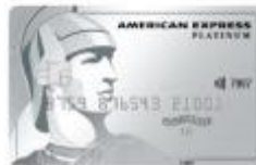
信用白金卡 晶華珍饈信用白金卡 376340~376349