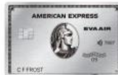
長榮航空簽帳白金卡 376357