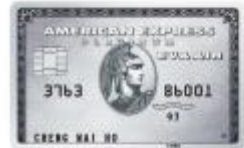
長榮航空簽帳白金卡 376357