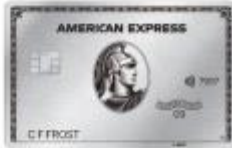
簽帳白金卡 376357 / 370133