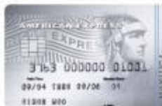
信用白金卡 晶華珍饈信用白金卡 376340~376349